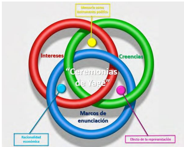
Gráfica 2. Dimensiones teóricometodológicas propuestas.

A partir de este ejemplo, se puede considerar que las creencias de las comunidades indígenas no preexistirían a sus procesos de representación, debido a que categorías externas tenderían a naturalizarse como si estuvieran dadas de antemano en estas, lo cual transforma sus concepciones sobre el mundo al generar una impresión de coherencia ante el sincretismo discursivo.