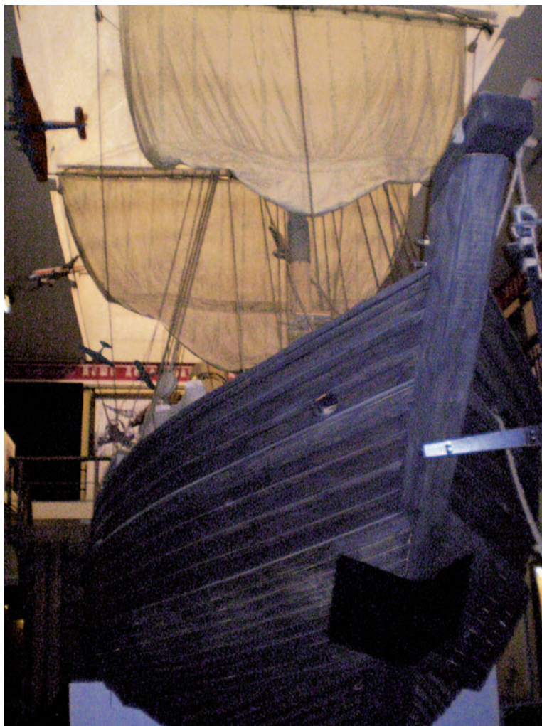
Reconstrucción de un Koch . Museo etnográfico Krasnoyarsk